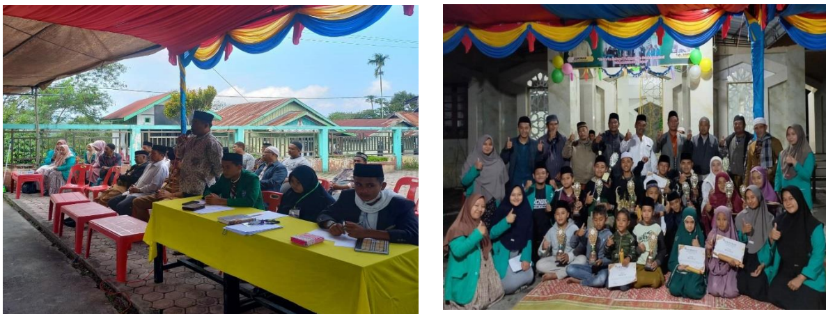
Gambar 5. Kegiatan Gebyar Ramadan

Kegiatan pembelajaran baca-tulis Al-Qur'an untuk anak-anak, pengajaran materi keislaman dan gebyar Ramadan merupakan kegiatan yang dirancang untuk mencapai tujuan pengabdian, yaitu untuk memberikan pemahaman agama dan meningkatkan kecerdasan spiritual bagi anak-anak, remaja, dan masyarakat Desa Dedingin. Ketiga kegiatan tersebut mendapatkan respon positif dari anak-anak dan masyarakat Desa Dedingin sehingga hal ini menjadi umpan baik bagi masyarakat. Selanjutnya, pemahaman agama beberapa masyarakat juga semakin baik. Hal ini terbukti dari keterlibatan masyarakat dalam mengisi ceramah pada saat salat Tarawih di bulan Ramadan dan ceramah Subuh di bulan Ramadan. Kecerdasan spiritual anak-