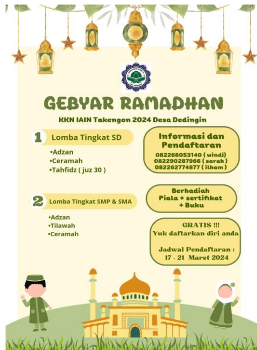
Gambar 4. Flyer pengumuman perlombaan