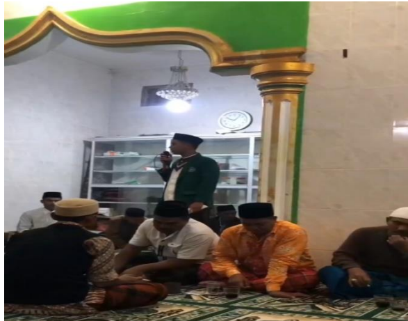
Gambar 3. Kegiatan Pengajaran Materi Keislaman