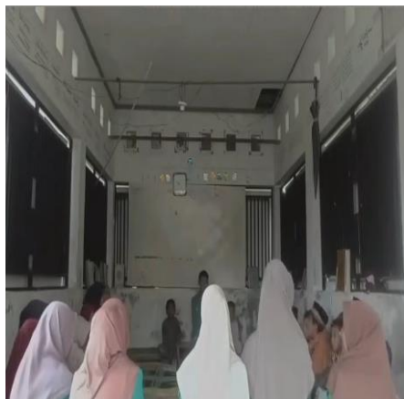
Gambar 2. Kegiatan Pengajian baca tulis Al-Quran di Desa Dedingin