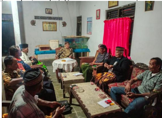
Gambar 4. Potret Kegiatan Macapatan Paguyuban Macapat Tresna Budaya , Bonorowo, Kebumen.

Terlihat bahwa bagi anggota Paguyuban Macapat Tresna Budaya, Al-Qur’an menjadi pedoman hidup yang utama. Mempelajari Al-Qur’an adalah suatu keniscayaan untuk dapat hidup dengan selamat dunia dan akhirat. Namun, tidak semua anggota mampu membaca apalagi memahami Al-Qur’an hanya dengan membaca mushaf maupun buku-buku agama. Salah satu alternatifnya adalah dengan macapatan, membaca dan menyanyikan Sekar Sari Kidung Rahayu (Sekar Macapat Terjemahanipun Juz ‘Amma) dengan penuh hikmat. Dengan macapatan seperti itu, tidak hanya nilai-nilai normatif (religius) yang didapat, tetapi juga nilai-nilai estetis (hiburan).